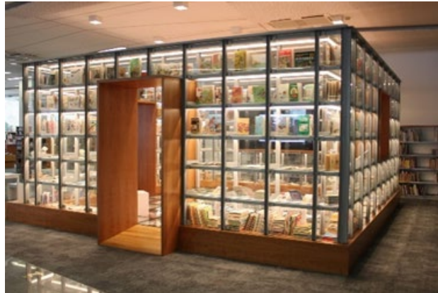
Stalna razstava Prva berila, umestitev klančine

Tudi v bodoče se bodo trudili, da bodo čim dostopnejši vsem uporabnikom, še posebej invalidom (katerim nudijo brezplačno članarino) ter uporabnikom s posebnimi potrebami in tako s svojo dejavnostjo in pozitivnim odnosom prispevali k izboljšanju njihovega življenja v naši lokalni skupnosti.