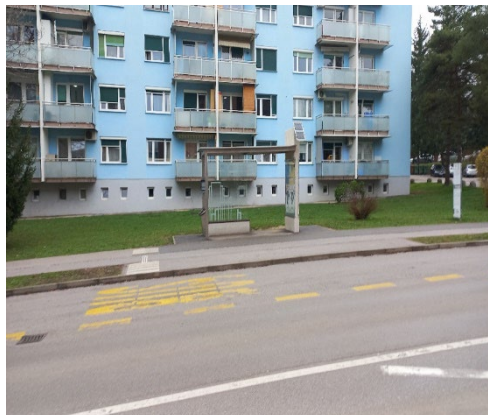
Na Tomšičevi cesti

Na Ljubljanski cesti so zgradili pločnik ter ponižali robnike v Starem Velenju.