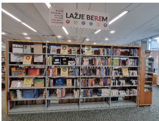
Posebna zbirka Lažje berem

V posebni zbirki, ki so jo poimenovali Lažje berem, je knjižno in neknjižno gradivo, primerno za osebe z okvarami vida, disleksijo, motnjami v duševnem razvoju, pa tudi za oklevajoče bralce in priseljence, ki še ne obvladajo dobro slovenskega jezika oziroma se ga učijo. Zbirka je locirana na posebnem mestu v knjižnici in dobro označena, tako s tablamami kot s piktogrami, ki nakazujejo šest skupin: disleksija, brajica, znakovni jezik, zvočne knjige, večji tisk in lahko branje. Poleg zbirke so postavili tudi omaro z bralnimi pripomočki (lupe, bralna očala in ravnila za dislektike) ter računalnik s sintetizatorjem govora. Le ta omogoča slepim in slabovidnim uporabnikom uporabo računalnika z dodatno prilagoditvijo. Računalnik je postavljen v kotichek z dodatno osvetlitvijo, kateri je namenjen predvsem slabovidnim uporabnikom.