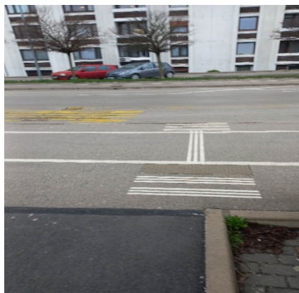
Na Jenkovi ceti