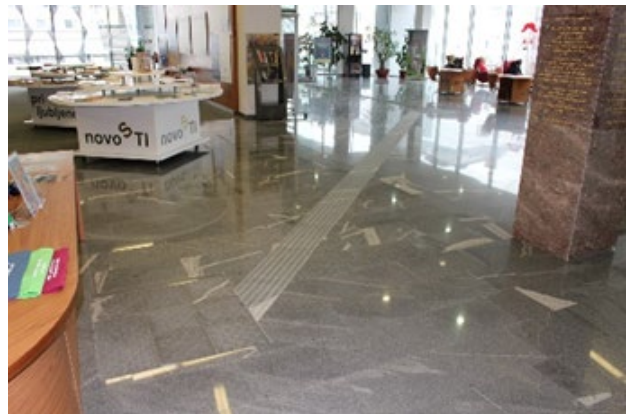
Taktilna pot od vhoda do izposojnega pulta