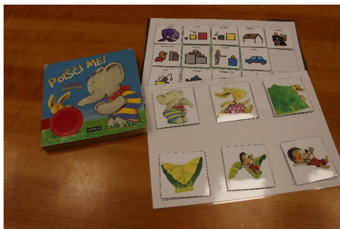
Nadomestna dopolnilna komunikacija