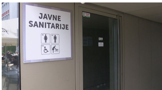
Garaža Zdravstveni dom Velenje

V javne sanitarije, ki jih uporabljajo izključno invalidi so nameščene t. i. EURO ključavnice. Tako je v sanitarije, namenjene invalidom, omogočen vstop samo osebam, ki imajo ta ključ. EURO ključavnice so v sanitarijah v garažni hiši Zdravstveni dom, Avtobusna postaja Nomago in Center Nova.