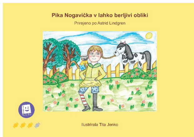
Knjiga Pika Nogavička v lahko berljivi obliki